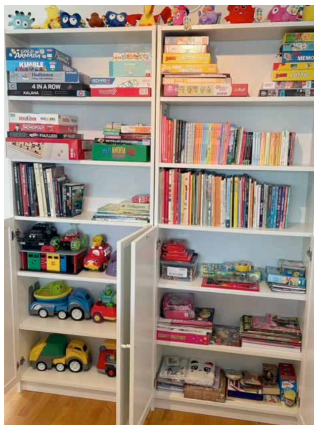
Barnhyllan har något för både stora och små.

I samtal med kvinnor framkommer det många gånger att barnen tvingats bevittna och uppleva våld i hemmet. Skammen att leva med en våldsam partner, som dessutom är pappa till ens barn, är stor och något man ogärna pratar om. Slutsatsen vi drar är att när kvinnorna berättar om det, har vi fått ett stort förtroende. Ett förtroende som kan ta många veckor att etablera.