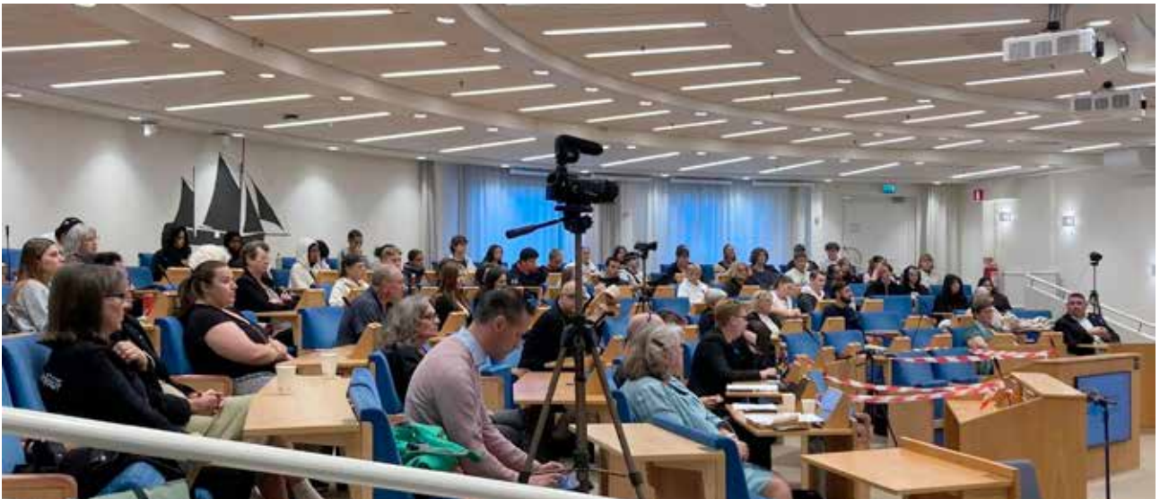
Panel samtal med politikerna – kommer Haninge kvinnojour att finnas kvar om fem år?