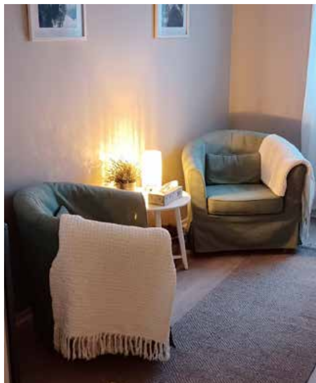
Anpassat rum för lugn och ro.

möbler. Ett rum har särskilt anpassats för lugn och ro. Där kan de som bor hos oss gå undan en stund, läsa en bok, erbjudas samtalsstöd eller bara få andas. Extra fokus har lagts på att förstärka barnperspektivet och skapa utrymmen där barnen får ta plats genom lek och skapande. Ett flertal av våra volontärer hjälpte till med att både måla om och att montera möbler, köra bort sopor och städa.