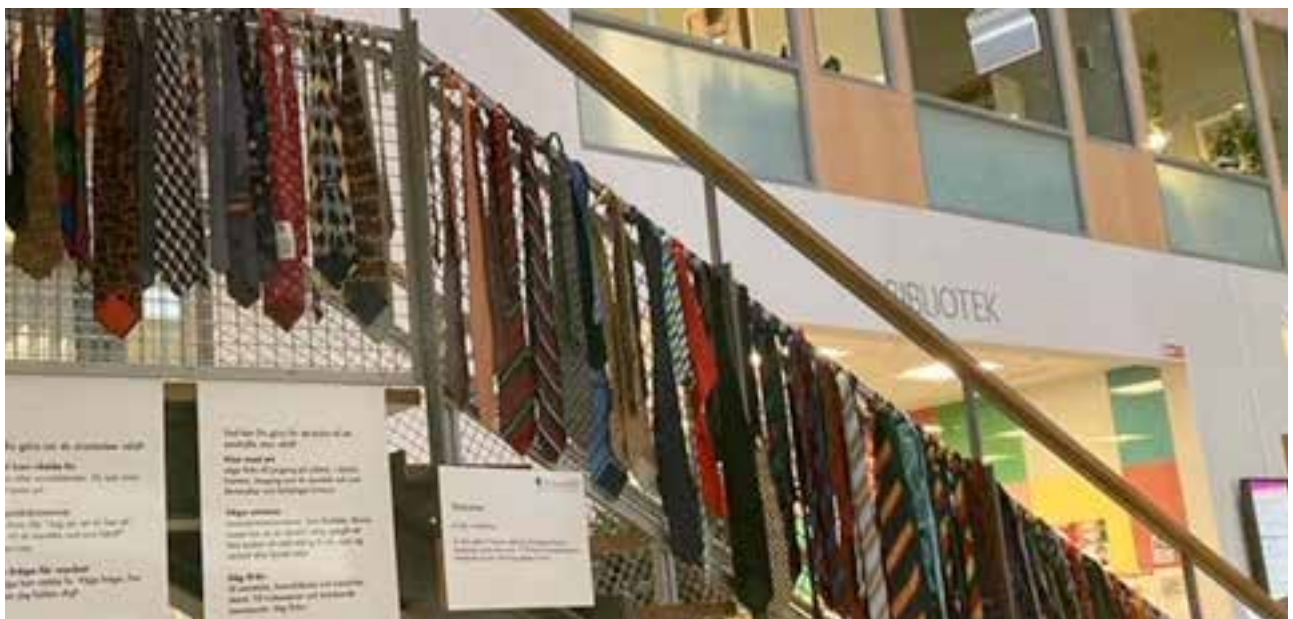
Bakom de utsatta kvinnorna finns alltid en förövare, en man. Vi synliggjorde dessa män med, en man = en slips.