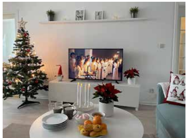
Julstämning i vårt skyddade boende

Möjlighet att söka ytterligare statliga medel utlystes av Socialstyrelsen i maj månad, vilka huvudsakligen skulle användas för kvalitetsförbättringsåtgärder på det skyddade boendet. Vi sökte och erhöll 417 161 kronor vilka har möjliggjort att vi kunnat anställa ytterligare en personal. Och kunnat fräscha upp boendet till version 2.0. Mer om det skriver vi under "Boendemiljö".