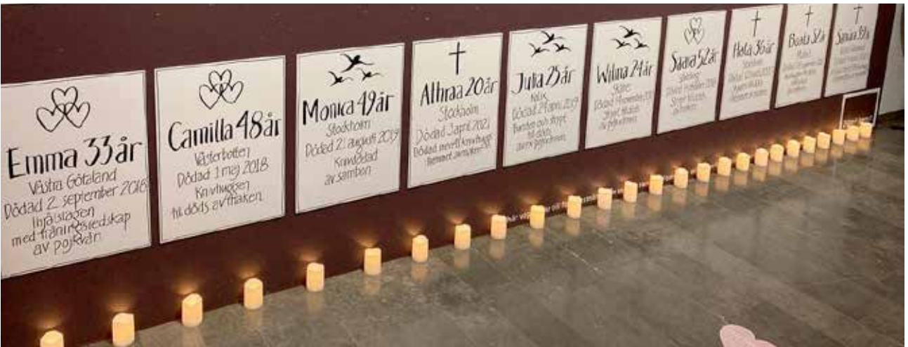
Dödsannonserna – namn på dödade kvinnor och sättet på vilket förövaren hade mördat henne står skrivet med obarmhärtig svärta på stora plakat.