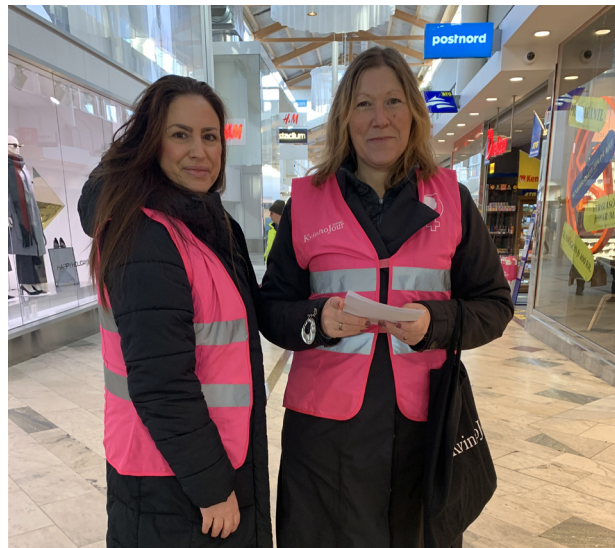
Volontärer i Haninge Centrum

Vi går in i år 2024 med 14 aktiva volontärer i föreningen. Vi blir gärna några fler och avser att rekrytera in dessa i samband med att vi genomför två studiecirkel under kommande år.