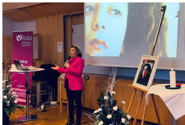
Roks årliga konferens till minne av Fadime