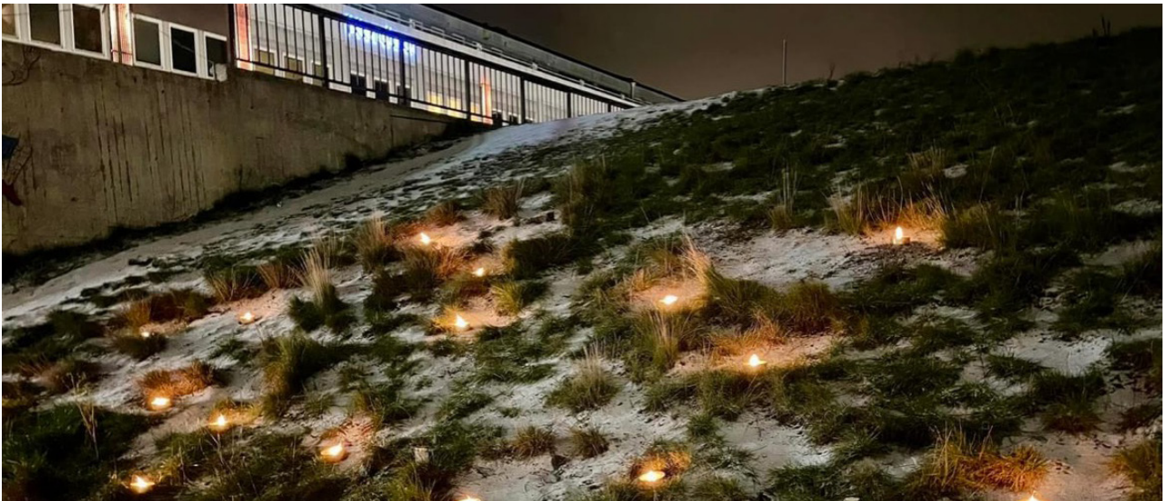
Ljusmanifestation, Haninge Entré