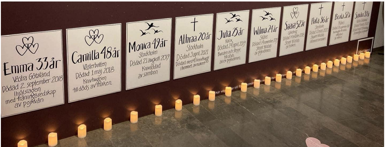
Dödsannonserna – namn på dödade kvinnor och sättet på vilket förövaren hade mördat henne står skrivet med obarmhärtig svärta på stora plakat