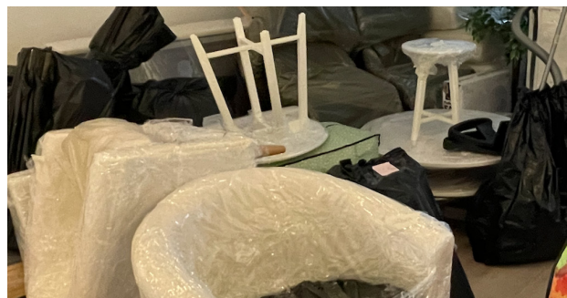
Nedläggning av det skyddade boendet

gör det. Å ena sidan en sorg över att vår kommun inte längre kan erbjuda kvinnor och barn ett akut skyddsboende, och å andra sidan en lättnad över att kunna släppa den del av vår verksamhet som dränerat mycket av vår energi och lust att bedriva föreningen Haninge kvinnojour. Från den 1 januari 2024 startar vi en Öppen verksamhet där vi fortsätter att ge våldsutsatta kvinnor och barn stöd, råd och gemenskap.