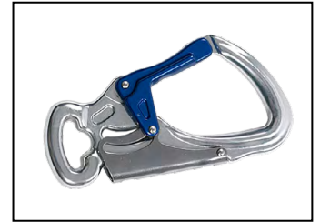
IKV 11 (EN 362:2004-T)