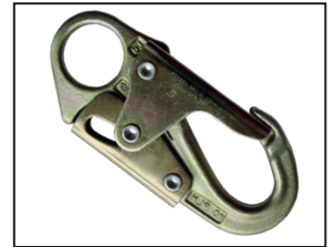
IKV 28 (ANSI Z.359.1-2007; CSA Z259.12-2011)