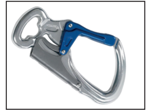
IKV 11 (EN 362:2004-T)